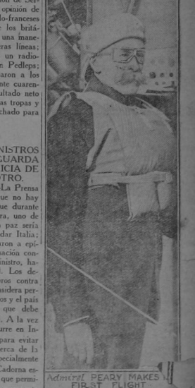
EL ALMIRANTE PEARY HA ORGANIZADO SU PRIMER VUELO