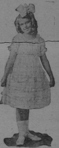
OLD MOTHER HUBBARD

A butterfly hair ribbon, white socked the baby neck and short, sleeves, also being attractively arranged on the skirt, and buttoned pumps finish the youthful belle's costume.